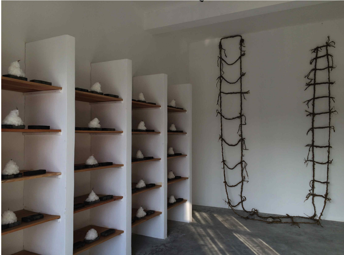
„20 Pyramids“ und „Purpose of Life“

Vor sechs Wochen bezogen Mascha und ich die Einzimmerwohnung in diesem Kunstzentrum in einer Vorstadt von Shanghai. Nun zeigt sie das Geschaffene in einer Einzelausstellung.