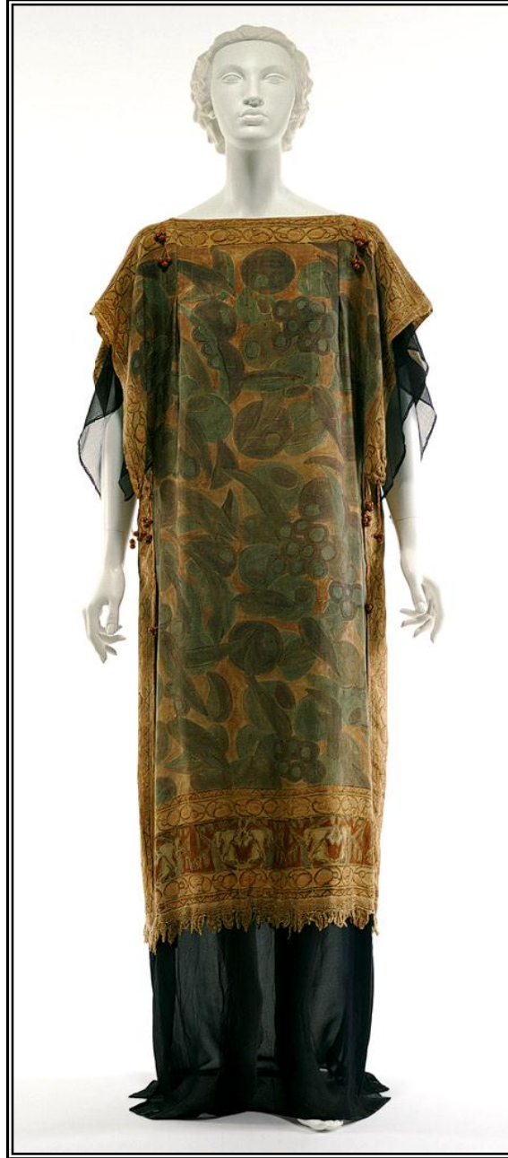
Resim 1: Raymond Duncan, Tunik, 1920.