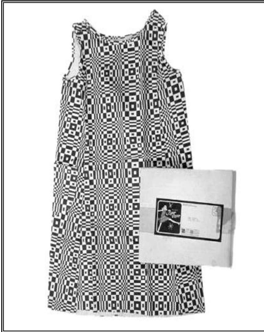
Resim 3: öPaper- Caper Scottö, Op Art Ka ıt Elbise, 1966.