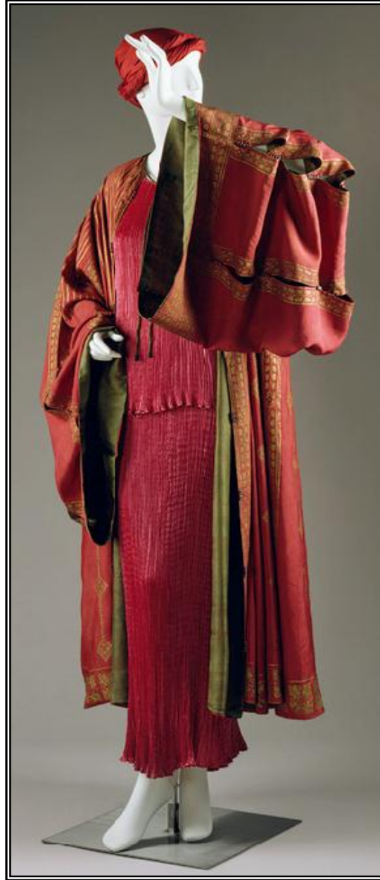
Resim 2: Mariano Fortuny, pek Kaftan, 1930.